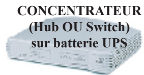
CONCENTRATEUR (Hub OU Switch) sur batterie UPS